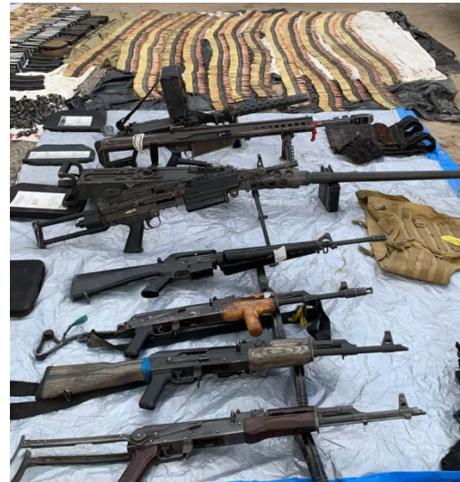
Armas recuperadas en Sinaloa marzo 2025